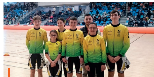
Les qualifiés lors des derniers championnats de France

i rcg.rollercourse.secretariat@gmail.com