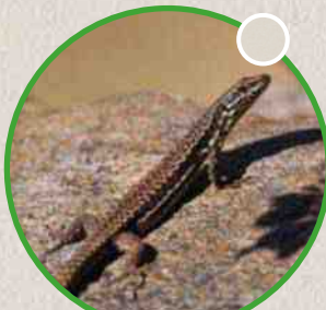
Le lézard des murailles