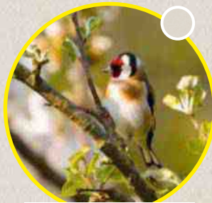
Le chardonneret élégant